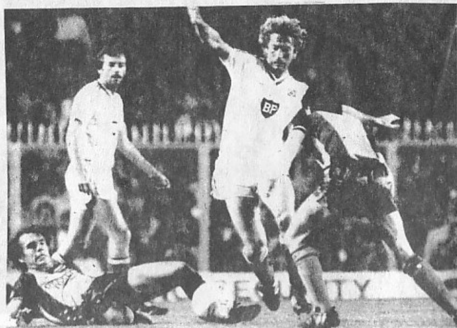
Момент от мача „Хамбургер ШФ“ — „Саутхямптън“